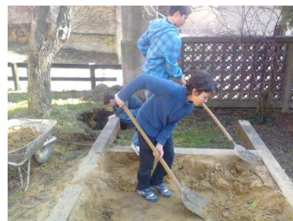
Pomáhání s úpravou

Uvedenými aktivitami a akcemi se nám daří aktivně naplňovat volný čas dětí, rozšířit možnosti trávení volného času pro děti a mládež ve Fryštáku. Snažíme se nabídnout taková témata, která by v mladých lidech probouzela jejich vlastní tvořivost a podněcovala je ke konkrétním činům. Rádi bychom, aby DIS-klub nabízel bezpečné prostředí, kde je možno realizovat svá přání.