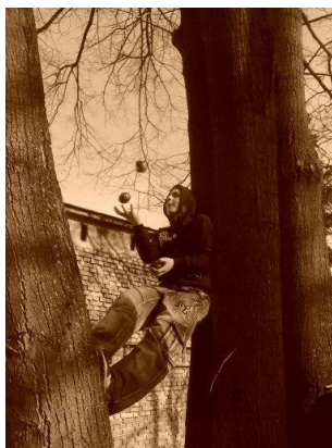
Žonglér Tom na stromě