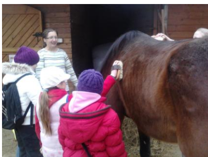
Za koníčky na příměstském táboře pískoviště